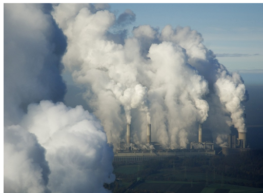
So ähnlich könnte es in Hamburg-Moorburg ab 2012 aussehen.

Ein Großteil der Hamburger Bevölkerung ist gegen den Bau des Kohlekraftwerks Moorburg. 3 Trotzdem erteilte die Behörde für Stadtentwicklung und Umwelt am 30. September 2008 die Baugenehmigung - mit Auflagen. Die Einsprüche von Greenpeace und vielen anderen bleiben ohne Erfolg.